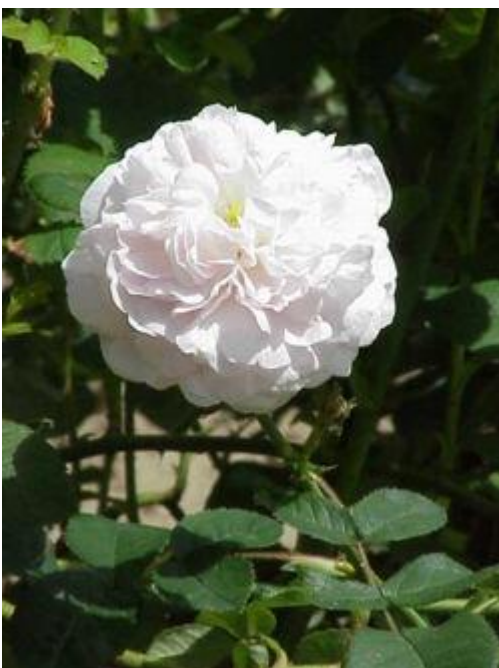
Rosa x alba