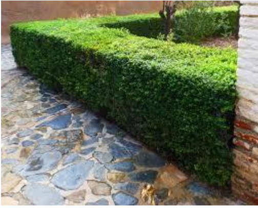
Myrtus communis (seto)